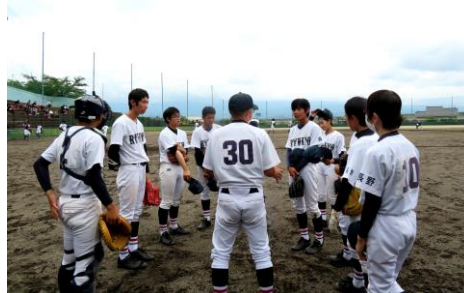
大会のようす(野球部)

この夏季大会は 3 年生にとっては、最後の大会となります。これまでを振り返ると、コロナ禍で活動ができない期間があったり、活動が再開されても制限されることがあったりと、すべてが満足いく活動ではなかったかもしれません。それでも、生徒達は自分が打ち込む部活動に、仲間と声をかけあって、共に励ましあい、共に汗を流しながら、心と体を鍛え、技を磨いてきました。本番ではそれぞれが精一杯の力を出し切ってくれたことと思います。ここまでの努力を讃えるとともに、生徒達には頑張ってきた自分に自信と誇りをもってほしいと思います。そして、ここまで生徒達を支え、温かい応援してくださった保護者の皆さんに厚くお礼を申し上げます。ありがとうございました。(裏面に結果を掲載しています)