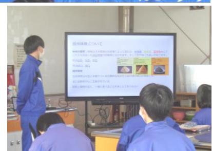
地域の食文化を発表