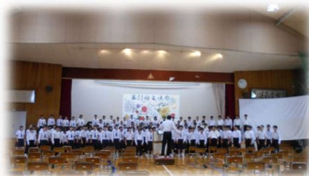
今年度の竜峡祭での全校合唱

保護者の皆様、地域の皆様には、2学期の教育活動や学校行事を行う上でたくさんのご理解、ご協力をいただきました。感謝申し上げます。3学期も引き続きよろしくお願いいたします。