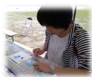
美術部の企画するワークショップに 地域の方が大勢訪れてくれていました