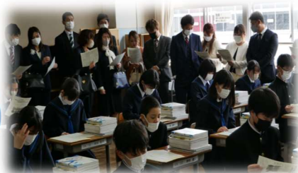
新しい級友との出会い