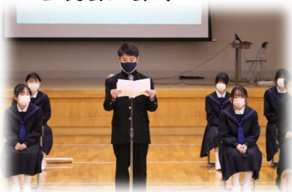
生徒会入会式 | 年代代表挨拶