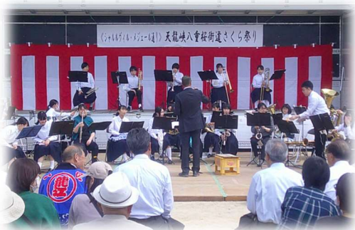
竜東中の仲間と一緒にステージ演奏

部活動も発足会を経て本格的に始動。1年生も徐々に練習に参加し始めました。運動部のみんなの元気な姿が体育館や校庭に見られます。今後の大会等での活躍が楽しみです。また、吹奏楽部、美術部は、地域とのつながりを大切に活動しています。先日の休みには、地域のお祭りに参加して、多くの人に発信してくれていました。