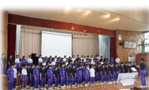
全校で創り上げる合唱曲「Gifts」