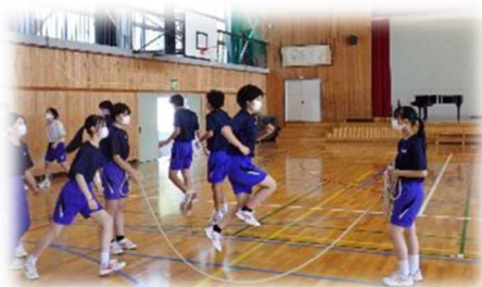
体育祭練習の様子

今年度の竜峡祭テーマ「憶(おもい)～共に翔び立つ時～」を達成するため、生徒達は全力を尽くしています。当日、ご来校いただく保護者の皆様、地域の皆さまに、これまでの生徒達の学習や活動の成果、そして当日の活動や発表を温かく見守っていただけたら幸いです。お待ちしております。