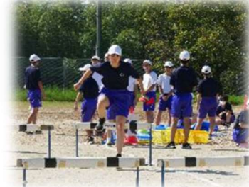
体育祭りハーサル