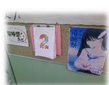
竜峡祭カウントダウンカレンダー