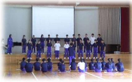
他の学年・クラスから学ぶ “歌声交流会”